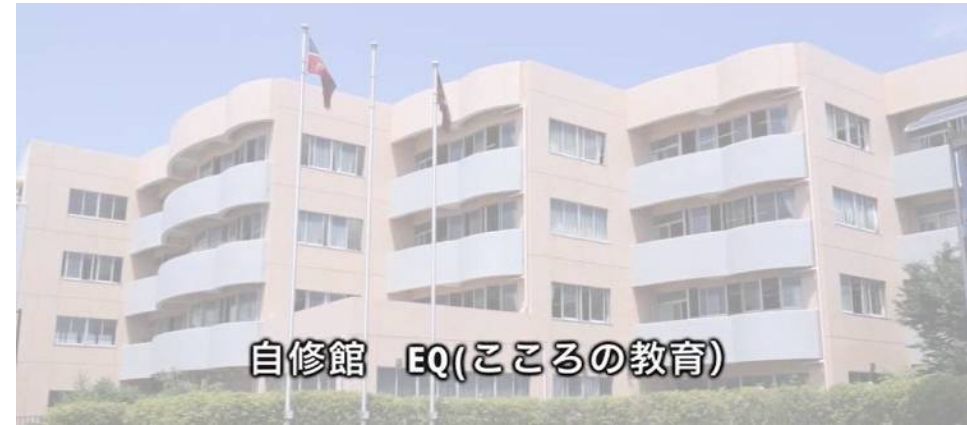
自修館中等教育学校（神奈川県・伊勢原市）