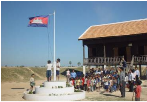
2003年3月 識字学校建設