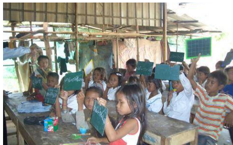
2011年6月より今日まで正規識字学校の支援