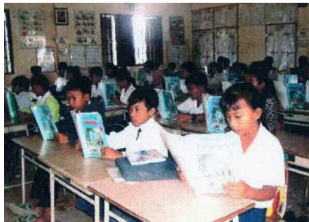
2009年から今日まで学校に教科書支援