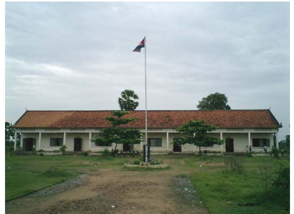
ルセイサン小学校

ニュースレター14号、15号で、アジア未来学校の状況を皆さまにお伝えしました。14号では、学校開設2年間の成果として、65名の子どもたちがカンボジア教育省制定の識字教育課程を終了し、隣村プラーカー村の公立ルセイサン小学校に転入できたこと、またその結果、昨年6月末で生徒数が45名になったことを報告しました。15号では、学校のあるアンロンコン・タマイ村に外国のNGOが参入し、現金を与えることで子どもを公立小学校に行かせるという活動を始めたこと、その結果アジア未来学校の生徒数が大幅に減り、昨年10月現在で7～8名になってしまったことを報告しました。