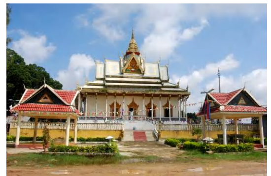
훌륭한 동네 절