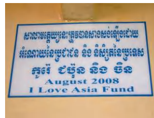
건물 정면에 붙여진 기부자 명단